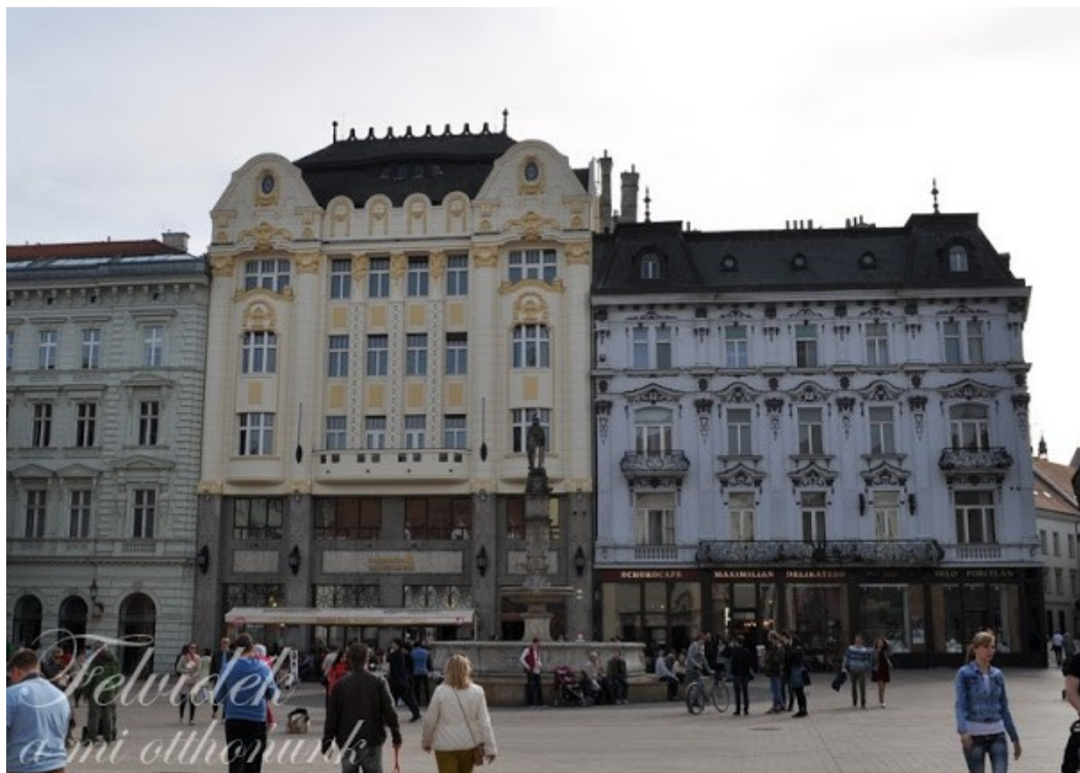
A két épület napjainkban