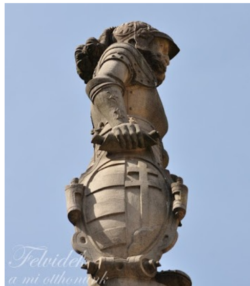
A Roland-szobor oldalról

A tér közepén, kicsit közelebb a Halász-kapu utcához helyezkedik el a Roland-kút, amelyet I. Miksa király parancsára készítettek egy régebbi kút helyén, elsősorban tűzoltás céljából. A díszkút tetején őrködő páncélos alak eredetileg színesre volt festve. A mai viszont csak egy másolat, az utolsó „restaurálás” áldozata lett a Roland-szobor.